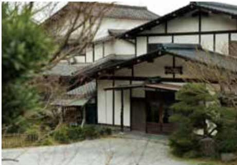
田戸裏や水琴窟があります