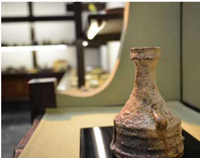
広い展示場には茶道具や日々の器