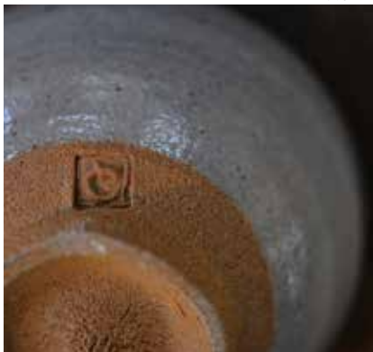
鏡山窯工房作品の印です