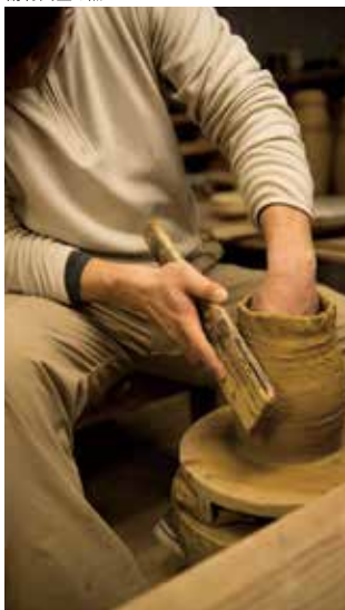
工房の見学も可能です