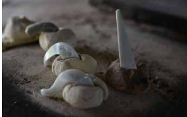
これで温度を計ります