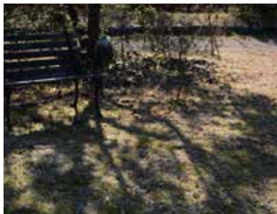
木漏れ日のなかで