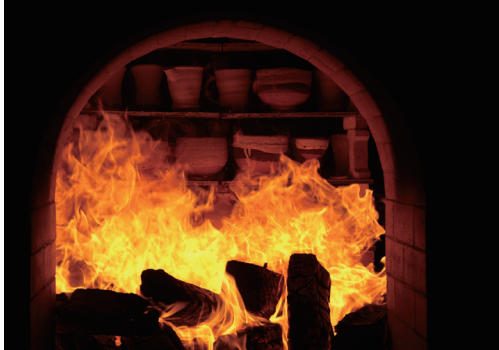
想いを込めての窯焚き