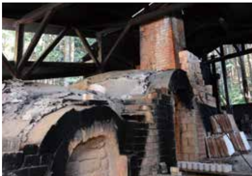
薪窯でこだわってます