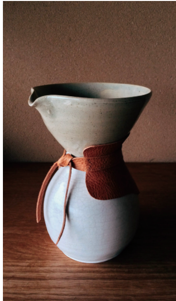
コーヒードリッパー