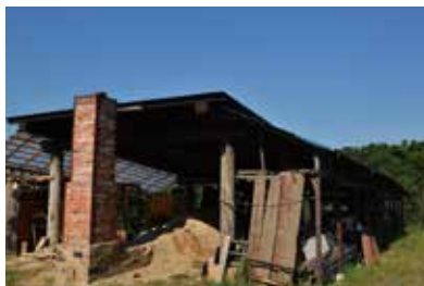
窯場。煙突は後で付けたもの