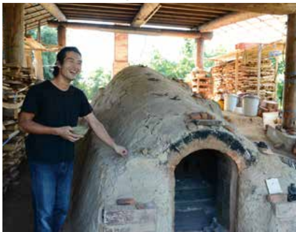
自作の登り窯(割竹式)。レンガを作るのに約半年