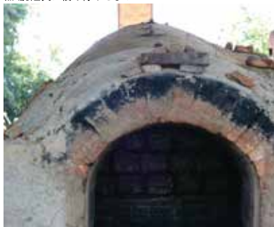
火に思いを込めて