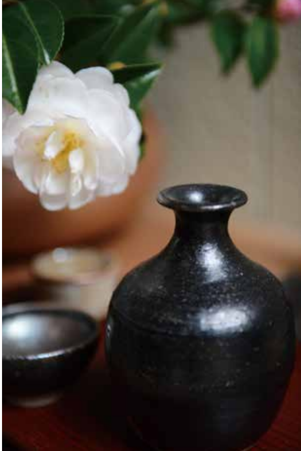
窯変黒唐津徳利と酒器 季節の花を飾り楽しむ