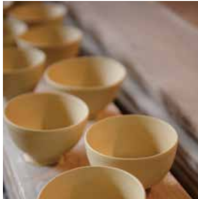
お茶碗に絵付け体験も好評です