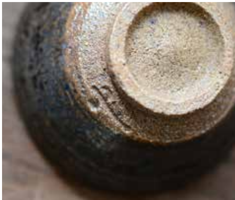
1300℃の高温でゆっくり時間をかけて焼成