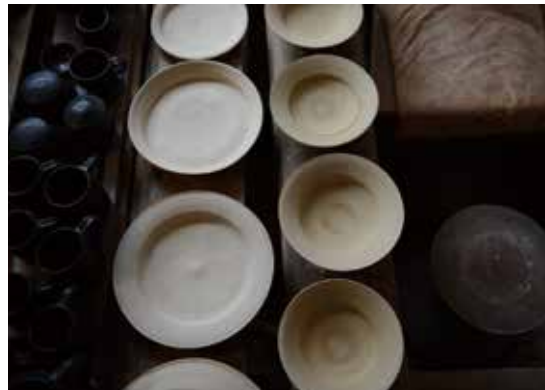
生まれたばかりの器たち