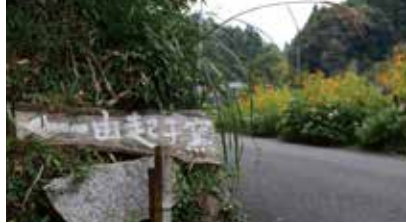
この先、紅葉と桜の木があり緑のトンネルで客人を迎える